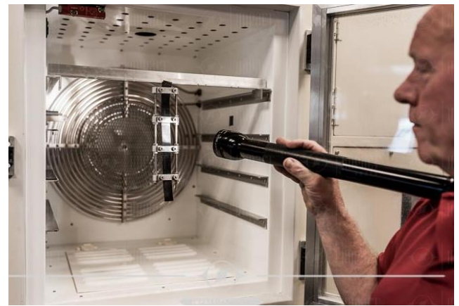
Tests en laboratoire Dunlop

Les bandes qui ne fonctionnent pas sous abri sont particulièrement sujettes aux fissures superficielles, ce qui peut être extrêmement nuisible à la performance de la bande et à sa durée de vie. Les conséquences des dommages provoqués par l'exposition à l'ozone au niveau environnemental et pour la santé et la sécurité sont encore plus graves car des particules de poussière des matériaux transportés pénètrent dans les fissures superficielles avant