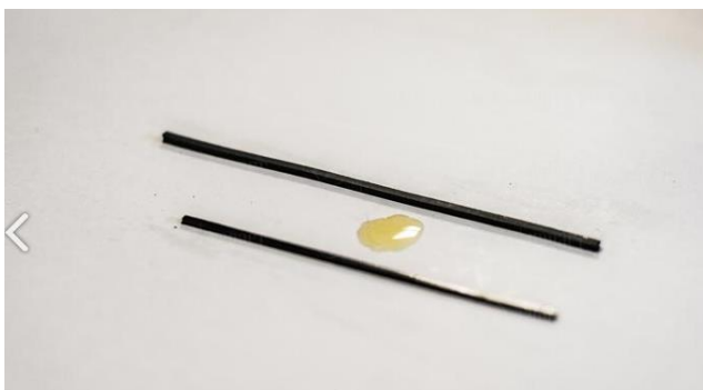
L'effet de l'huile sur le caoutchouc

Les huiles et graisses provoquant ces problèmes peuvent être réparties en deux grandes catégories : celles d'origine minérale et celles d'origine animale. L'huile minérale est généralement un dérivé liquide du raffinage du pétrole brut pour obtenir de l'essence et d'autres produits pétroliers. Ses composants principaux sont des alcanes et des cyclo alcanes liés au pétrole. On trouve des dépôts importants d'huile minérale dans les déchets ménagers et industriels. Il existe une différence importante dans le gonflement provoqué par différentes huiles minérales sur les composés en caoutchouc synthétique.